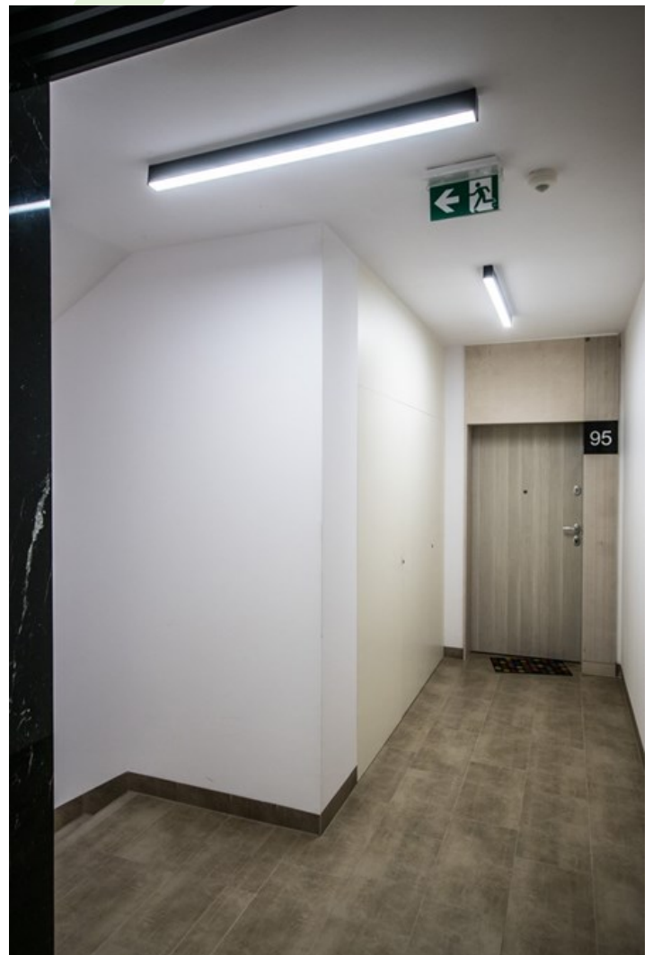
Haven House, Warschau

Innenbeleuchtung. Montage: Anbau an der Decke. Gehäuse aus Aluminium. Arbeitstemperaturbereich: 5 ÷ 30° C. Stoßfestigkeitsgrad: IK04. Schutzklasse: I.