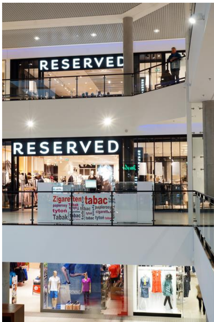
Galeria handlowa "Corso", Świnoujście

Oprawa wyposażona w wysokowydajne moduły LED renomowanych firm. TEAR LED przystosowany jest do montażu na szynie trójfazowej lub na suficie za pomocą bazy sufitowej. Korpus wykonany został z odlewu aluminiowego. Wersja kolorystyczna: biała lub czarna. Oprawa ta rekomendowana jest do oświetlania witryn, wystaw sklepowych, wnętrz sklepów, centrów kultury i sztuki czyli wszędzie tam, gdzie przy pomocy oświetlenia akcentującego możemy wyeksponować pojedynczy produkt, przyciągając jednocześnie uwagę Klienta.