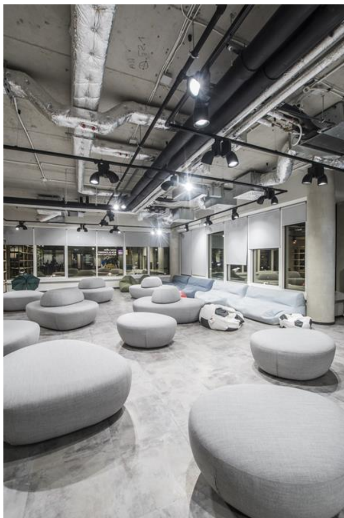
Alior Bank, Warszawa

Oprawa wyposażona w wysokowydajne moduły LED renomowanych firm. TEAR LED przystosowany jest do montażu na szynie trójfazowej lub na suficie za pomocą bazy sufitowej. Korpus wykonany został z odlewu aluminiowego. Wersja kolorystyczna: biała lub czarna. Oprawa ta rekomendowana jest do oświetlenia witryn, wystaw sklepowych, wnętrz sklepów, centrów kultury i sztuki czyli wszędzie tam, gdzie przy pomocy oświetlenia akcentującego możemy wyeksponować pojedynczy produkt, przyciągając jednocześnie uwagę Klienta.