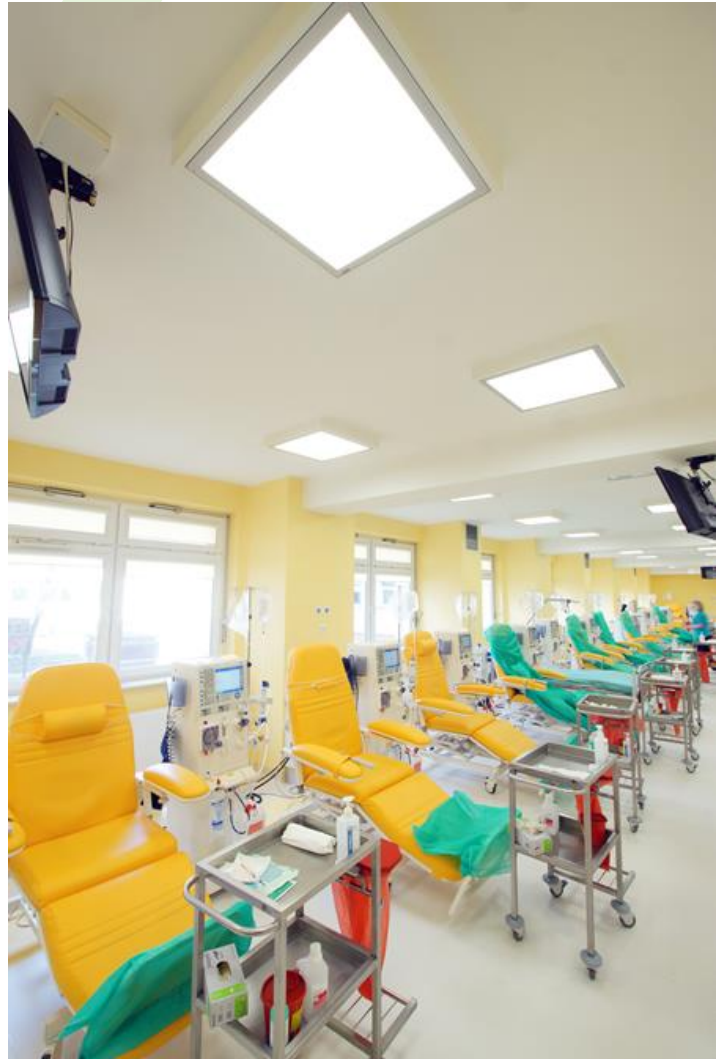
Dialysis station, hospital in Łomża

Luminaire dedicated for the clean rooms of increased cleanliness class ISO 5-6. Surface mounted luminaire equipped in highly efficient LED sources. Luminaire body made from steel sheet, powder coated in white. Diffusers and optical systems in aluminum frame.