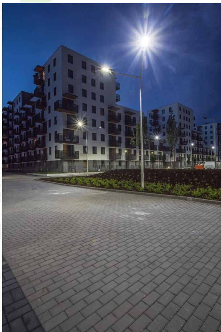
Osiedle na Woli, Warschau

Außenbeleuchtung. Montage: Mastmontage. Gehäuse aus Aluminium. Arbeitstemperaturbereich: -40 \div 40^{\circ} C. Stoßfestigkeitsgrad: IK09. Schutzklasse: I. *Ausgewählte Leuchtenvarianten sind mit ENEC-Zertifikat erhältlich.