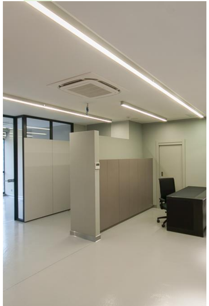
Kanzlei in Katowice

Innenbeleuchtung. Montage: Anbau an der Decke oder an Aufhängebügeln. Gehäuse aus Aluminium. Arbeitstemperaturbereich: 5 \div 30^{\circ} \text{C} . Stoßfestigkeitsgrad: IK04. Schutzklasse: I.