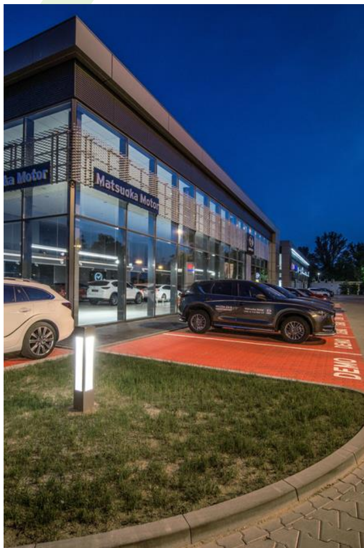
Mazda Autohaus, Łódź

Außenbeleuchtung. Montage: Pollerleuchte. Gehäuse aus Aluminium. Arbeitstemperaturbereich: -25 \div 30^{\circ} C. Stoßfestigkeitsgrad: IK08. Schutzklasse: I.