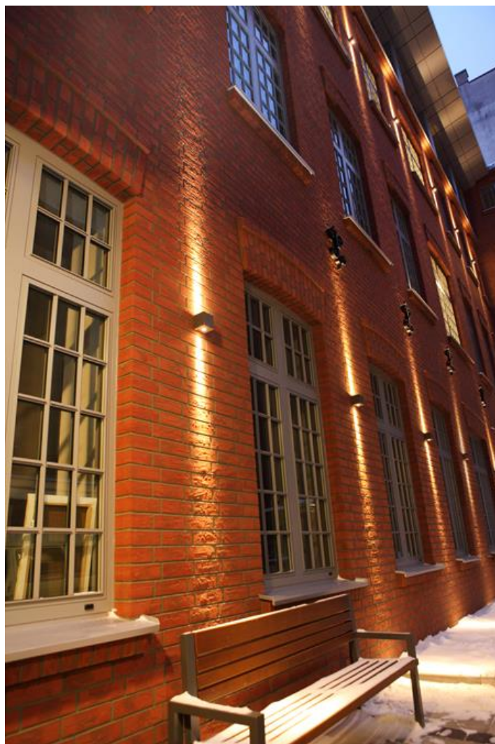
Wyższa Szkoła Ekologii i Zarządzania, Warszawa

Oprawa architektoniczna przeznaczona do oświetlenia elewacji budynków, tworzenia efektów świetlnych. Korpus wykonany z aluminium malowanego specjalną farbą fasadową odporną na warunki atmosferyczne. Energooszczędna oprawa, w której wykorzystane zostały komponenty renomowanych firm. Możliwość zastosowania różnych kolorów LED na specjalne życzenie Klienta. Ergonomiczne kształty oprawy pozwalają na zastosowanie oprawy Kubik niemalże w każdym budynku. Bardzo łatwy montaż i dostęp do wnętrza. Oprawa charakteryzuje się wysokim stopniem ochrony przed wnikaniem ciał stałych i wody IP65, co czyni tę oprawę ciekawym rozwiązaniem dekoracyjnym podkreślającym architekturę oświetlanego obiektu.