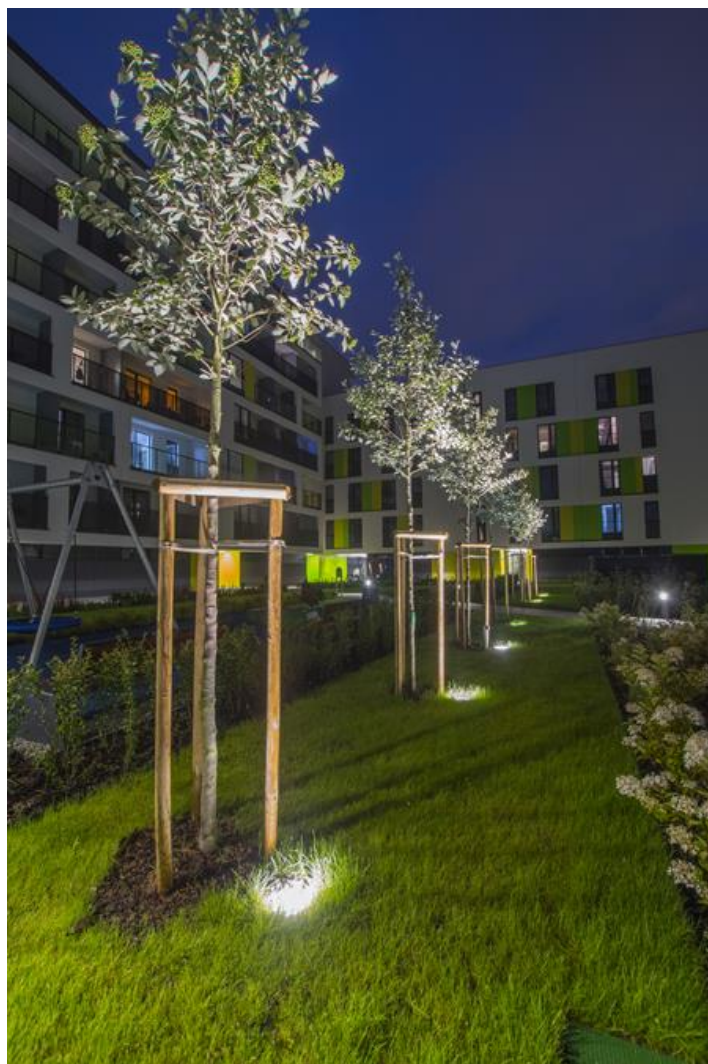
Artystyczny Żoliborz, Warszawa

Oprawa do wbudowania do ziemi, korpus wykonany z odlewu wysokociśnieniowego aluminium, odporny na korozję, przesłona z szyby hartowanej o grubości 10 mm, natomiast pierścień z wysokiej jakości stali nierdzewnej INOX. Mocowanie pierścienia do korpusu odbywa się za pomocą wkrętów ze stali nierdzewnej. Optykę oprawy stanowi aluminium anodyzowane o wysokim poziomie sprawności. Uszczelki silikonowe zapewniają długą żywotność i eksploatację oprawy. Oprawa dostarczana jest z puszką montażową w komplecie. Oprawa wyposażona w przewód zasilający 3x1,5 mm 2 o długości 1,5 m. Odporność na obciążenia statyczne 2000 kg. Oprawa rekomendowana jest do oświetlenia obiektów architektonicznych oraz przyrodniczych.