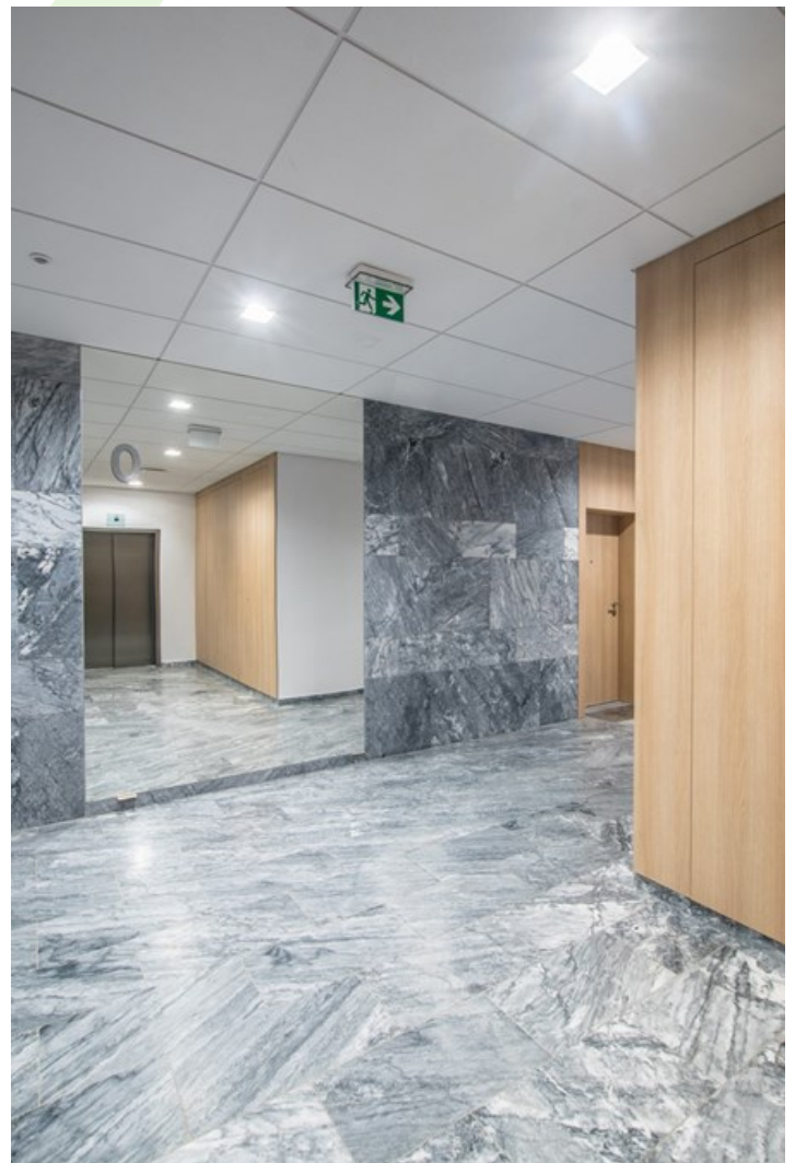
"Nova Królikarnia", Warschau

Innenbeleuchtung. Montage: in Moduldecken und Gipskartondecken. Gehäuse aus Aluminium. Arbeitstemperaturbereich: 5 ÷ 30° C. Stoßfestigkeitsgrad: IK04. Schutzklasse: II. Die Farbe des Rahmens und des Gehäuses hat einen etwas anderen Farbton als die innere Reflektorabdeckung.