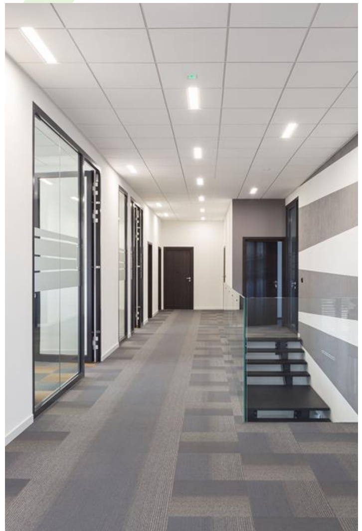
Biura Formed, Żywiec

Oprawa wykonana z blachy stalowej malowanej proszkowo. Zastosowano w niej wysokowydajne i energooszczędne źródła LED. W produkcie wykorzystano przesłone opalizowaną PMMA. Oprawa przeznaczona jest do sufitu modułowego. Może być zastosowana w budynkach użyteczności publicznej, biurach, salach konferencyjnych.