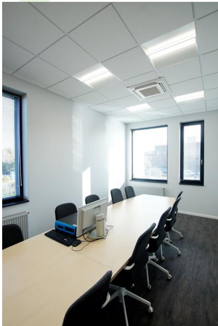
Druckerei "Print Group", Szczecin

Innenbeleuchtung. Montage: Einbauleuchte für Deckenmontage. Bei Rigipsdecken Montage mittels zusätzlich Einbaurahmen G/K. Gehäuse aus Stahlblech. Arbeitstemperaturbereich: 5 ÷ 30° C. Stoßfestigkeitsgrad: IK04. Schutzklasse: I.