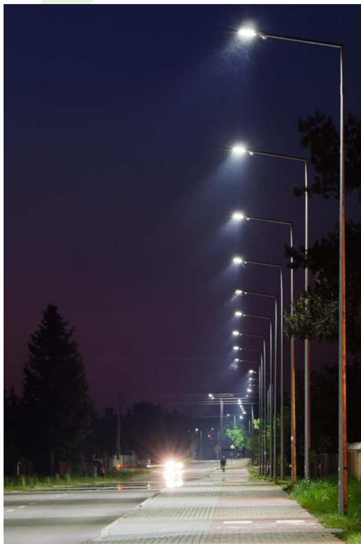
Polna Straße, Kodeń

Außenbeleuchtung. Montage: Mastmontage. Gehäuse aus Aluminium. Arbeitstemperaturbereich: -40 ÷ 40° C. Stoßfestigkeitsgrad: IK09. Schutzklasse: I.