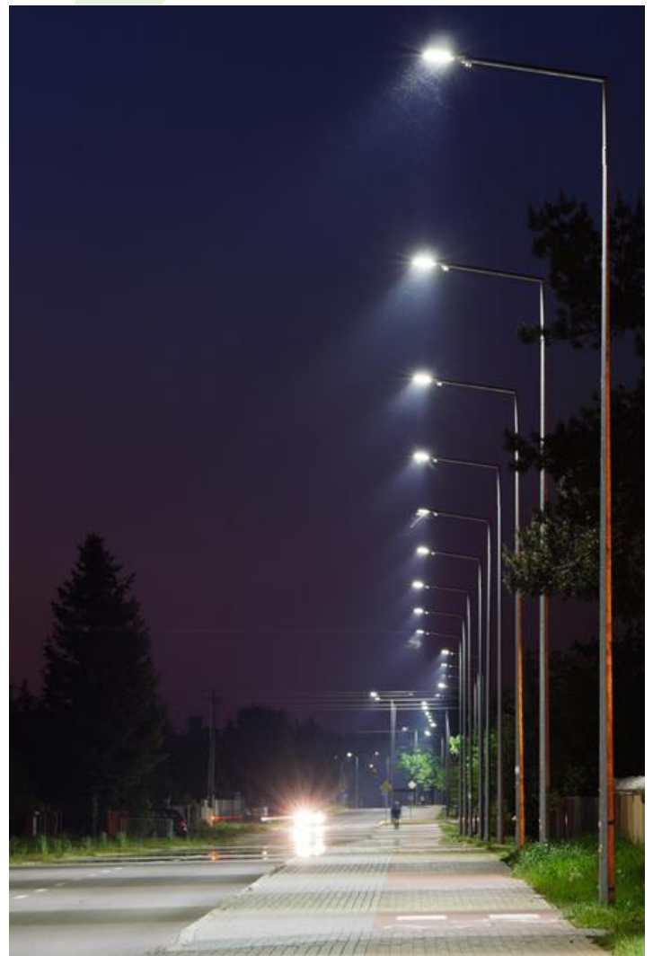
Polna Straße, Kodeń

Außenbeleuchtung. Montage: Mastmontage. Gehäuse aus Aluminium. Arbeitstemperaturbereich: -40 ÷ 40° C. Stoßfestigkeitsgrad: IK09. Schutzklasse: I.