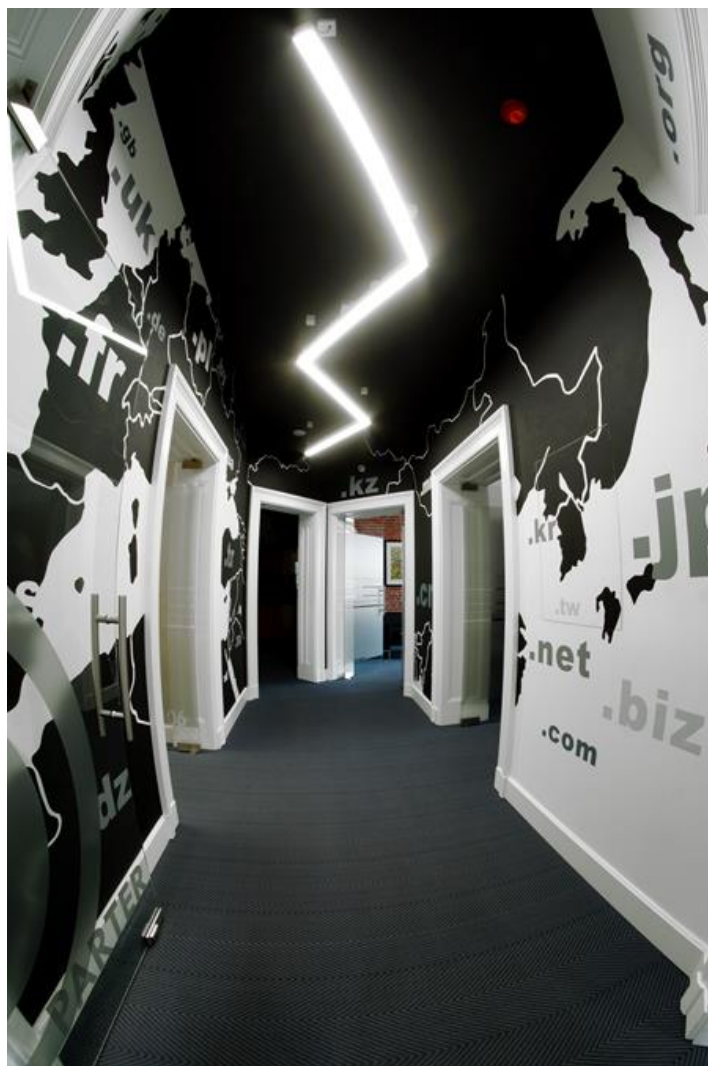
Biura domena.pl, Bydgoszcz

Oprawa oświetleniowa wyposażona w wysokowydajne źródła LED. Korpus wykonany z profilu aluminium. Optyka oprawy zapewnia równomierny rozkład światła na przesłonie. Dostępne dwa rodzaje przesłon: opalizowane lub mikropryzmatyczne PMMA. Oprawa przystosowana do montażu na zwieszakach lub bezpośrednio na konstrukcji sufitu stałego. Wersja zwieszana wyposażona w system zawieszni o długości 1500 mm, z systemem płynnej regulacji wysokości zwieszenia. Oprawy mogą stać się ozdobą miejsc reprezentacyjnych, takich jak: strefy wejść, recepcje, restauracje, korytarze etc.