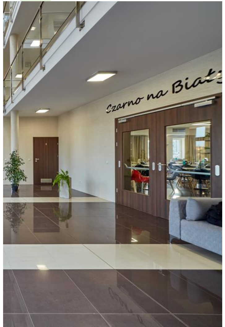
Hotel "Czarno na białym", Kraków

Oprawa przeznaczona do montażu nastropowego, do źródeł LED. Kaseton oprawy wykonany z blachy stalowej, lakierowanej proszkowo. Oprawa rekomendowana do: sal chorych, łazienek komunikacji szpitalnej.