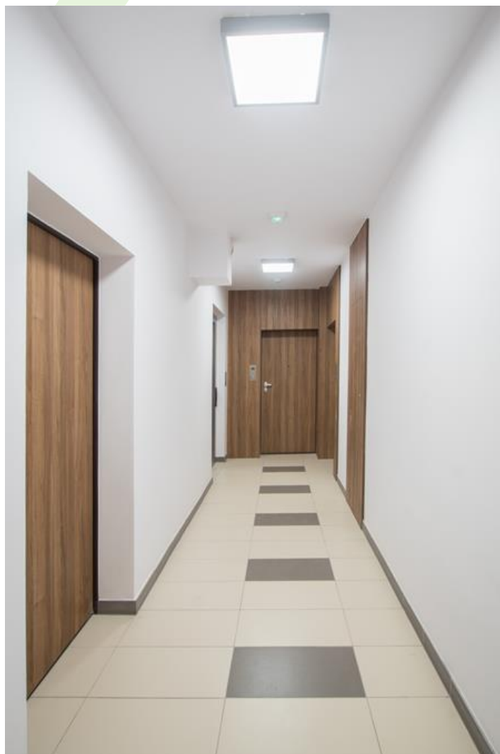
Grójecka 216, Warschau

Innenbeleuchtung. Montage: Anbau an der Decke. Gehäuse aus Stahlblech. Arbeitstemperaturbereich: 5 \div 30^\circ \text{C} . Stoßfestigkeitsgrad: IK04. Schutzklasse: I.