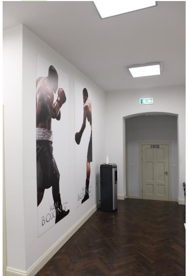
Vivid Games, Bydgoszcz

Oprawa przeznaczona do montażu nastropowego, wyposażona w wysokowydajne źródła LED. Kaseton oprawy wykonany z blachy stalowej, lakierowanej proszkowo.