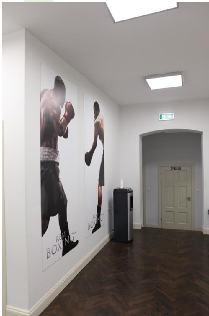
Vivid Games, Bydgoszcz

Innenbeleuchtung. Montage: Anbau an der Decke. Gehäuse aus Stahlblech. Arbeitstemperaturbereich: 5 ÷ 30° C. Stoßfestigkeitsgrad: IK04. Schutzklasse: I.