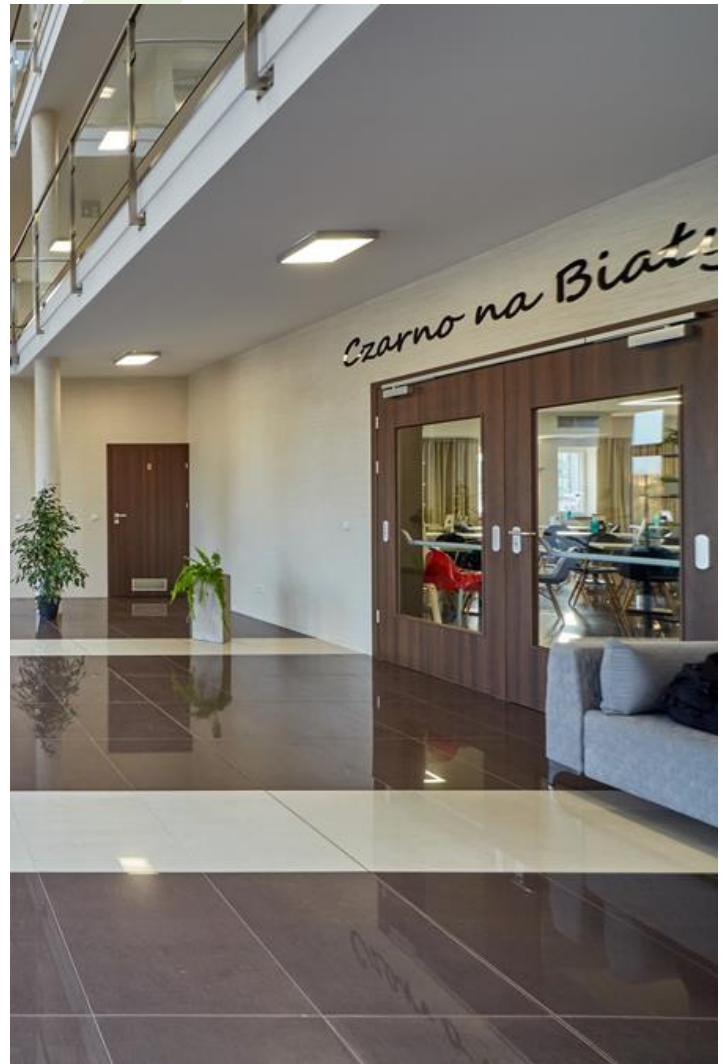
Hotel "Czarno na białym", Krakau

Innenbeleuchtung. Montage: Anbau an der Decke. Gehäuse aus Stahlblech. Arbeitstemperaturbereich: 5 \div 30^\circ \text{C} . Stoßfestigkeitsgrad: IK04. Schutzklasse: I.