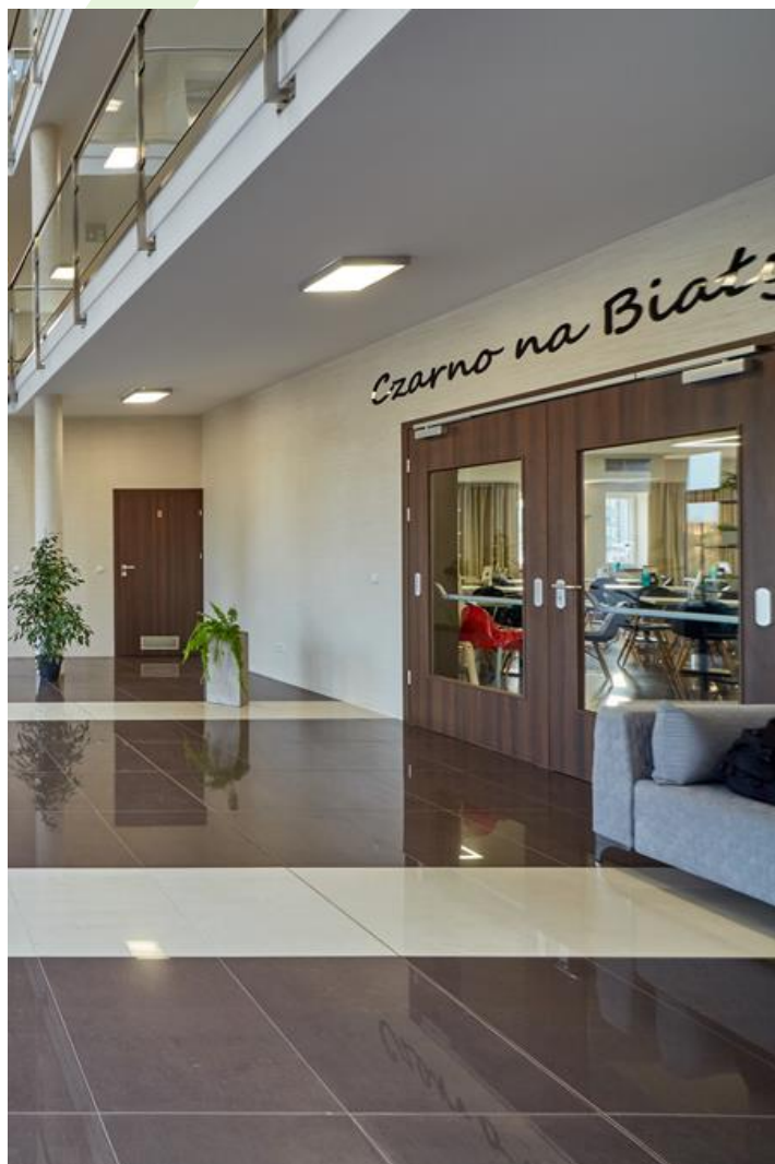
Hotel "Czarno na białym", Krakau

Innenbeleuchtung. Montage: Anbau an der Decke. Gehäuse aus Stahlblech. Arbeitstemperaturbereich: 5 \div 30^{\circ} \text{C} . Stoßfestigkeitsgrad: IK04. Schutzklasse: I.