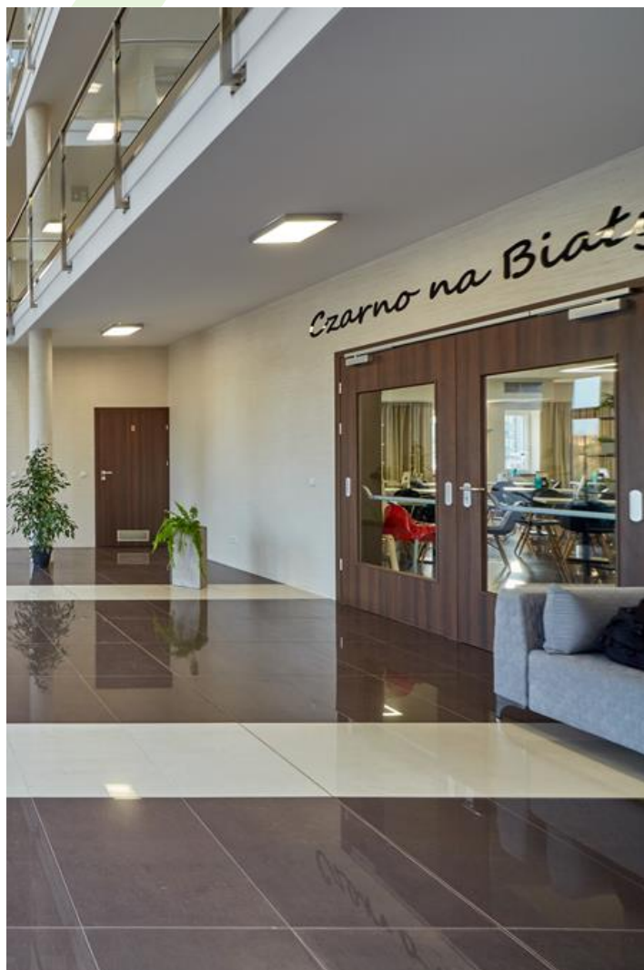
Hotel "Czarno na białym", Krakau

Innenbeleuchtung. Montage: Anbau an der Decke. Gehäuse aus Stahlblech. Arbeitstemperaturbereich: 5 \div 30^{\circ} C. Stoßfestigkeitsgrad: IK04. Schutzklasse: I.