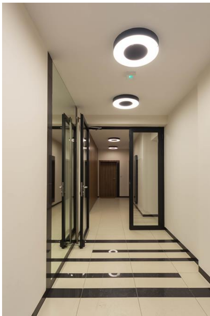
Artystyczny Żoliborz, Warszawa

Finezyjna oprawa dająca efekty niepowtarzalnego świeżącego ringu przeznaczona do montażu nastropowego, wyposażona w wysokowydajne źródła LED. Oprawa daje możliwość unikatowego oświetlenia wnętrza. Wskaźnik oddawania barw Ra>80. Kaseton oprawy wykonany z blachy stalowej, lakierowanej proszkowo, standardowo na kolor biały. Przesłona oprawy wykonana z opalizowanego PMMA. Stopień ochrony przed wnikaniem pyłu i wody - IP40. Pierwsza klasa ochrony przed porażeniem prądem elektrycznym.