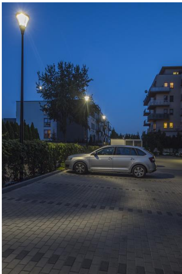
Osiedle Jardin Bemowo, Warszawa

Oprawa zewnętrzna parkowa i ogrodowa, do źródeł powszechnego użytku na popularny trzonek E27. Korpus wykonany z odlewu aluminium, źródło osłonięte rastrem aluminiowym ograniczającym ośnienie, przesłona przezroczysta wykonana z poliwęglanu o wysokim stopniu odporności na czynniki mechaniczne. Zewnętrzna powłoka zapewnia wysoki poziom odporności na wszelkiego rodzaju czynniki atmosferyczne oraz estetyczny wygląd oprawy w trakcie całego okresu eksploatacji. Oprawa jest szczególnie rekomendowana do oświetlania skwerów, placów, parków, otwartych przestrzeni.