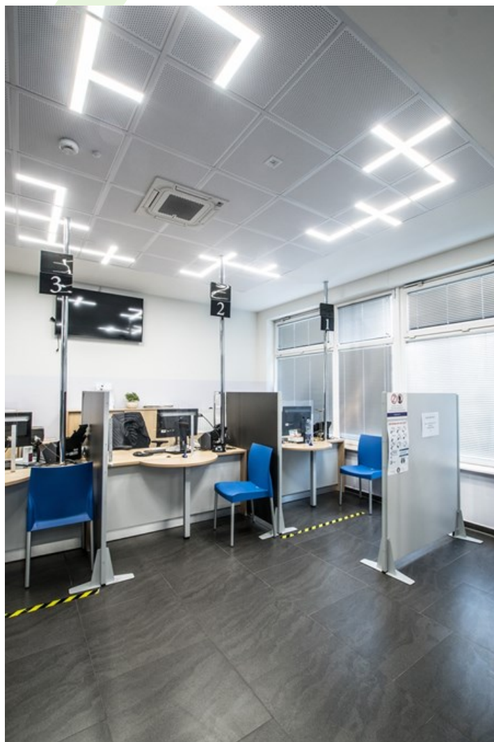
Nationales Gesundheitsamt, Szczecin

Innenbeleuchtung. Montage: in Moduldecken. Gehäuse aus Stahlblech. Arbeitstemperaturbereich: 5 \div 30^{\circ} \text{C} . Stoßfestigkeitsgrad: IK04. Schutzklasse: I.