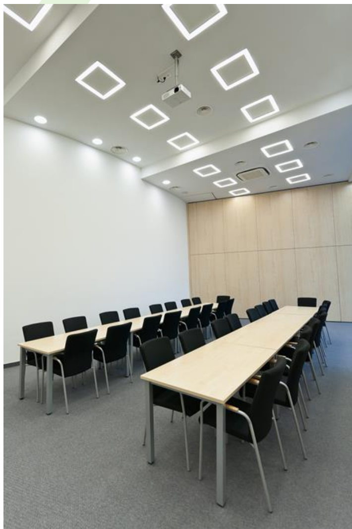
Mercedes Autohause, Stryków

Innenbeleuchtung. Montage: in Moduldecken und Gipskartondecken. Gehäuse aus Stahlblech. Arbeitstemperaturbereich: 5 \div 30^{\circ} \text{C} . Stoßfestigkeitsgrad: IK04. Schutzklasse: I.