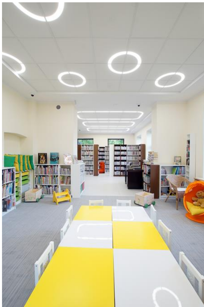
Biblioteka Publiczna, Konstancin-Jeziorna

System przeznaczony jest do sufitów podwieszanych, modułowych 600x600. Budowa modułowa/ segmentowa. W skład systemu wchodzi następujące elementy: prosty, łuk, kształt plusa, kształt litery L i kształt litery T. Kombinacje tych elementów dają nieograniczone możliwości aranżacji oświetlenia wnętrza. Można łączyć funkcjonalność oświetlenia z niepowtarzalną estetyką pomieszczenia. W każdej chwili można zmienić położenie segmentów przekręcając poszczególne płyty sufitowe. Stosując kolorowe przesłony lub paski LED RGB można uzyskać dodatkowe efekty kolorystyczne. System LEDowy można łatwo ściemniać uzyskując dodatkowe oszczędności energii elektrycznej.