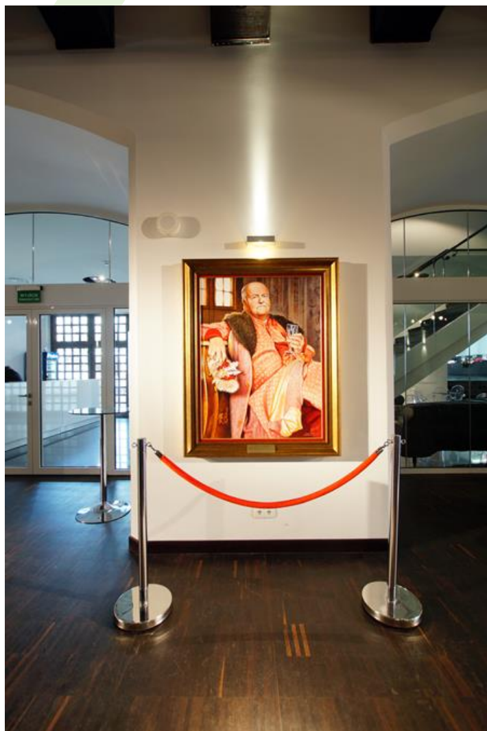
Schloss Oper, Szczecin

Innenbeleuchtung. Montage: Wandleuchte. Gehäuse aus Aluminium. Arbeitstemperaturbereich: 5 ÷ 30° C. Stoßfestigkeitsgrad: IK04. Schutzklasse: I.