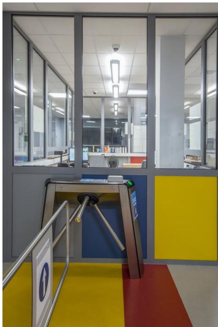
Pływalnia Rodzinna, Białystok

O walorach opraw oświetleniowych, stosowanych w obiektach użytkowych, decydują przede wszystkim właściwości świetlne. Forma opraw powinna być prosta, nie angażująca uwagi użytkownika. Dobrze zaprojektowane oświetlenie buduje pozytywną atmosferę wnętrza, a wysoka sprawność świetlna opraw powoduje, że czujemy się w nim komfortowo. Oprawa dekoracyjna, zwieszana o bezpośrednim rozsyłe światła. Charakteryzuje się wysokimi parametrami świetlnymi i subtelną konstrukcją. Kaseton oprawy wykonany z blachy stalowej malowanej proszkowo. Standardowy kolor oprawy - szary. Bardzo duża różnorodność wartości strumieni świetlnych. Wskaźnik oddawania barw CRI>80. Oprawa idealnie wpisuje się w wystój pomieszczeń reprezentacyjnych.