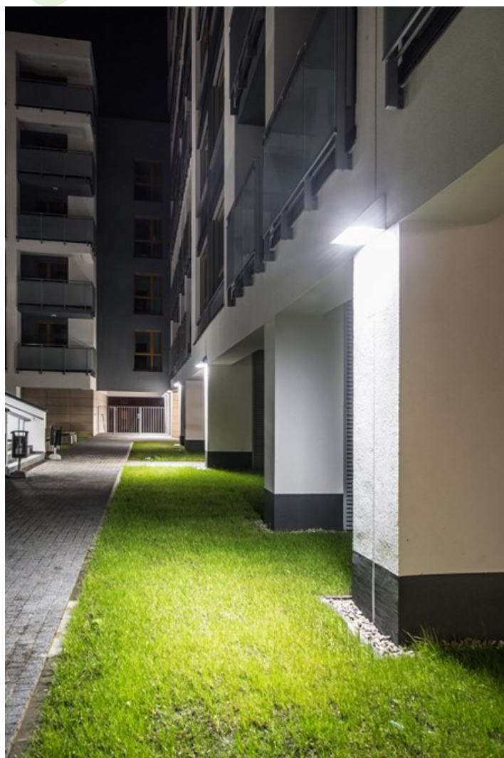
RSM Praga – ul. Osowskiego 11, Warszawa

Oprawa architektoniczna przeznaczona do oświetlenia elewacji budynków, tworzenia efektów świetlnych. Korpus wykonany z aluminium malowanego specjalną farbą fasadową odporną na warunki atmosferyczne. Energooszczędna oprawa, w której wykorzystane zostały komponenty renomowanych firm. Oprawa charakteryzuje się wysokim stopniem ochrony przed wnikaniem ciał stałych i wody IP65, co czyni tę oprawę ciekawym rozwiązaniem dekoracyjnym podkreślającym architekturę oświetlanego obiektu.