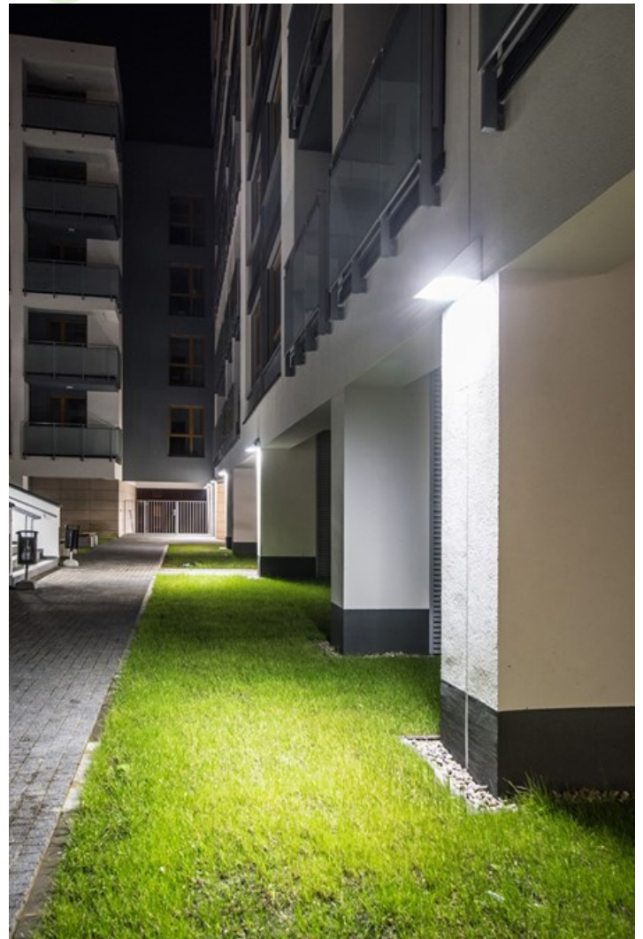
RSM Praga – ul. Osowskiego 11, Warszawa

Oprawa architektoniczna przeznaczona do oświetlenia elewacji budynków, tworzenia efektów świetlnych. Korpus wykonany z aluminium malowanego specjalną farbą fasadową odporną na warunki atmosferyczne. Energooszczędna oprawa, w której wykorzystane zostały komponenty renomowanych firm. Oprawa charakteryzuje się wysokim stopniem ochrony przed wnikaniem ciał stałych i wody IP65, co czyni tę oprawę ciekawym rozwiązaniem dekoracyjnym podkreślającym architekturę oświetlanego obiektu.