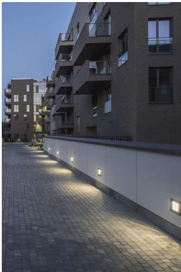
Osiedle "Awangarda", Warszawa

Oprawa architektoniczna przeznaczona do oświetlenia elewacji budynków i tworzenia efektów świetlnych. Montaż w ścianie przy pomocy puszkii montażowej dostępnej w komplecie. Obudowa wykonana z aluminium malowanego specjalną farbą fasadową odporną na warunki atmosferyczne. Energooszczędna oprawa, w której wykorzystane zostały komponenty renomowanych firm. Ergonomiczne kształty oprawy pozwalają na zastosowanie oprawy Kubik IN LED niemalże w każdym budynku. Bardzo łatwy montaż. Oprawa charakteryzuje się wysokim stopniem ochrony przed wnikaniem ciał stałych i wody IP65, co czyni tę oprawę ciekawym rozwiązaniem dekoracyjnym podkreślającym architekturę oświetlanego obiektu.