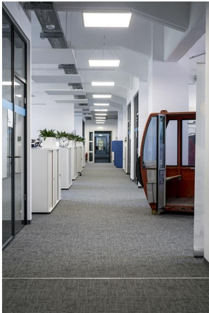
Lufthansa Systems, Berlin

Nowoczesny panel LED przeznaczony do montażu na zawieszach. Wyposażony w wysokowydajne źródła światła LED. Korpus wykonany z aluminium. Kolor oprawy - biały. Wskaźnik oddawania barw CRI>80. Zastosowanie: pomieszczenia użyteczności publicznej, biura, sale konferencyjne, lekcyjne, wykładowe itp. Producent informuje, że podczas pracy oprawy dopuszczalne są widoczne odkształcenia oprawy od płaszczyzny poziomej w granicach +/-6 mm. Spowodowane jest to naturalnym zjawiskiem rozszerzalności cieplnej materiałów oraz własnym ciężarem. W przypadku konieczności zachowania większych tolerancji płaskości prosimy o kontakt z naszym przedstawicielem handlowym w celu dobrania odpowiedniego rozwiązania oświetlenia.