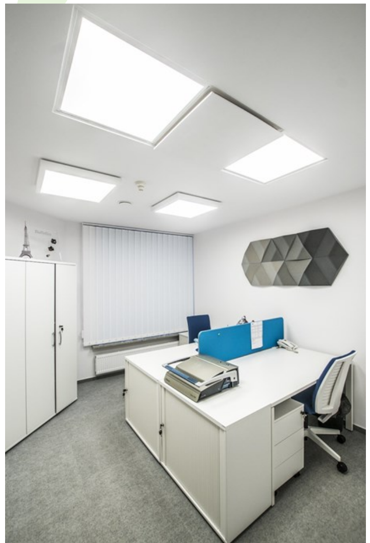
Biuro Babyliiss PARIS, Warszawa

Nowoczesny panel LED przeznaczony do montażu w sufitach podwieszonych lub bezpośrednio na stropie. Wyposażony w wysokowydajne źródła światła LED. Korpus wykonany z aluminium. Kolor oprawy - biały. Zastosowanie: pomieszczenia użyteczności publicznej, biura, sale konferencyjne, lekcyjne, wykładowe itp. Stopień ochrony przed wnikaniem ciał stałych, pyłu i wilgoci – IP65.