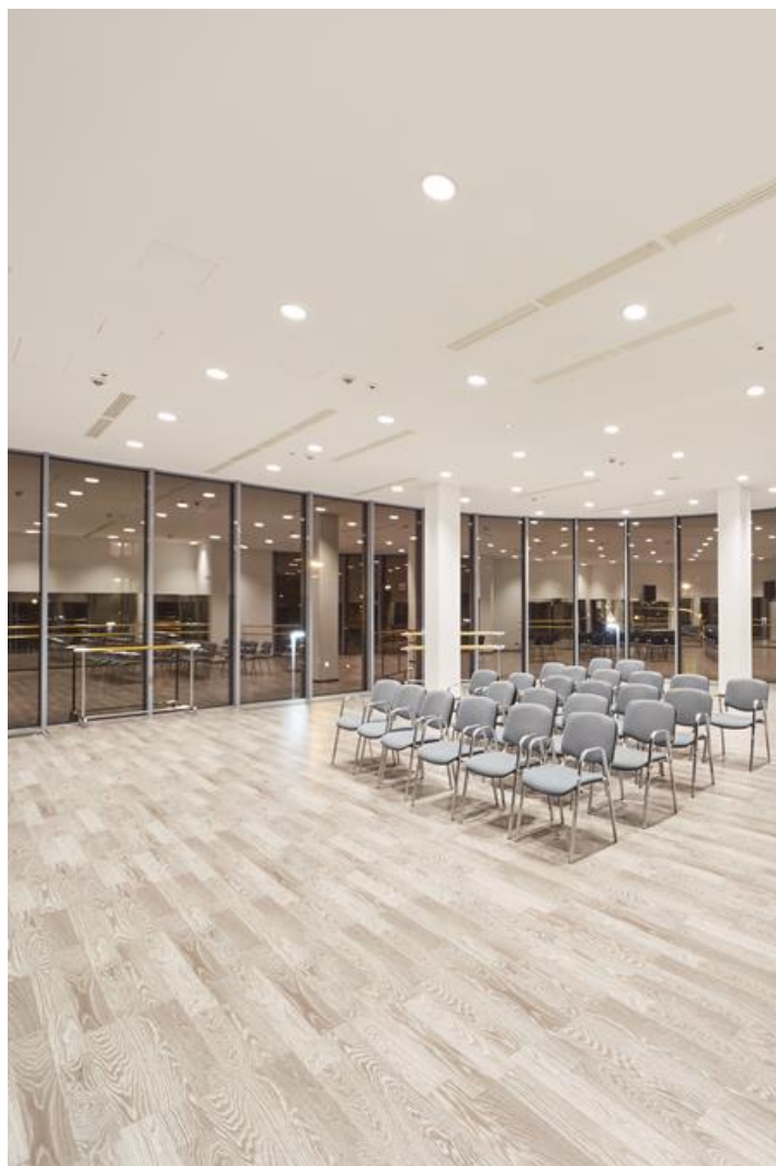
Centrum Kultury, Koźienice

Korpus oprawy wykonany z odlewu aluminiowego. Technologia ta zdecydowanie zwiększa możliwości zastosowania danej oprawy ze względu na mniejsze obciążenie sufitów, ponieważ nie jest wymagany dodatkowy radiator chłodzący. Oprawy te stosowane są do oświetlenia wnętrz o znaczeniu prestiżowym, takich jak: hotele, banki, biura o podwyższonym standardzie. Dzięki zastosowaniu najnowszych komponentów oraz ledów renomowanych firm możliwe stało się zbudowanie takich opraw oświetleniowych, które przynoszą znaczące oszczędności w zużyciu energii elektrycznej w porównaniu do tradycyjnych rozwiązań. Oprawa wyposażona w moduły LED dostosowane do regulacji temperatury barwowej światła w zakresie od 2450 K do 7000 K.