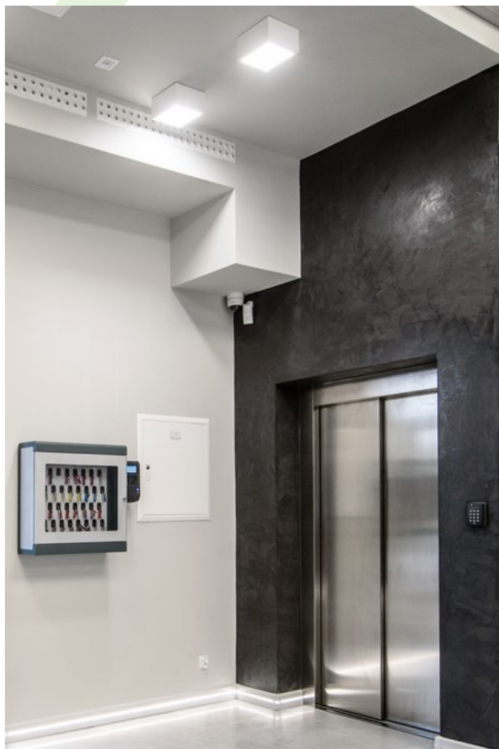
Kunstgalerie "Stara Łażnia", Suwałki

Innenbeleuchtung. Montage: Anbau an der Decke. Gehäuse aus Stahlblech. Arbeitstemperaturbereich: 5 \div 30^\circ \text{C} . Stoßfestigkeitsgrad: IK06. Schutzklasse: I.