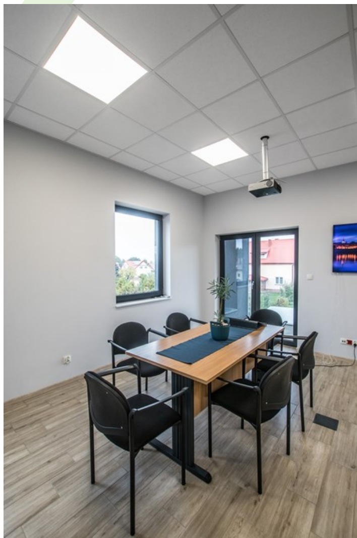
Elclim Büro, Toruń

Innenbeleuchtung. Montage: Einbauleuchte für Deckenmontage (fakultativ: Leuchtaufhängung, Deckenanbaurahmen, Rahmen oder Griff für Gipskartondecken). Gehäuse aus Stahlblech. Arbeitstemperaturbereich: 5 ÷ 30° C. Stoßfestigkeitsgrad: IK04. Schutzklasse: II.