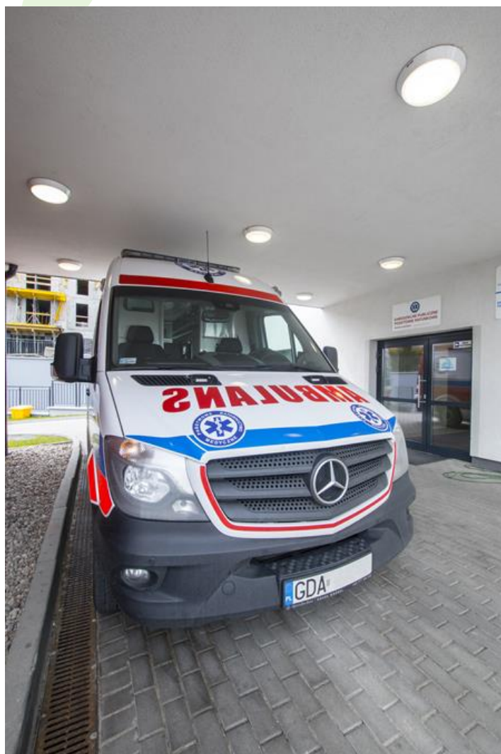
Samodzielne Publiczne Pogotowie Ratunkowe, Pruszcz Gdański

Oprawa przeznaczona do montażu nastropowego na suficie lub ścianie, wyposażona w wysokowydajne panele LED. Korpus oprawy i przesłona wykonane z tworzywa odpornego na uderzenia IK10. Oprawa hermetyczna IP65. Oprawa rekomendowana do pomieszczeń typu: łazienki, sale chorych, pomieszczenia personelu medycznego, jak również na zewnątrz.