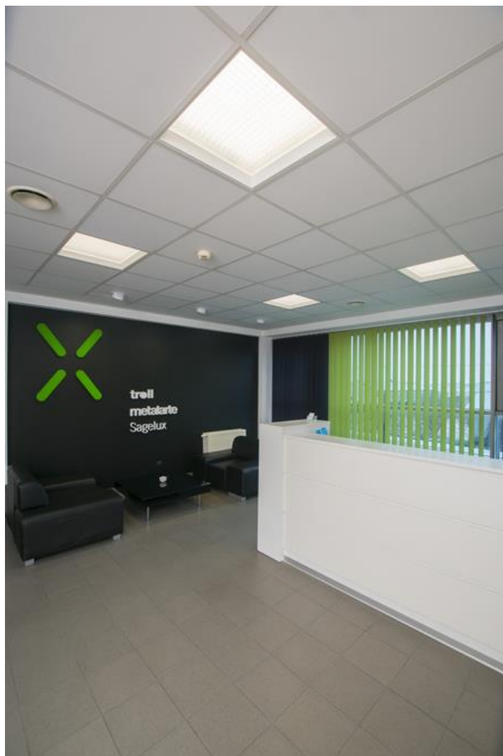
Biuro Luxiona Poland, Warszawa

Oprawa kasetonowa do sufitów podwieszanych modułowych. Kaseton produktu wykonany z blachy stalowej, lakierowanej proszkowo na kolor biały. Cechą charakterystyczną Agata LED Deco Smooth jest „wsunięta” przesłona, która po zamontowaniu oprawy znajduje się powyżej poziomu sufitu. Zabieg ten daje bardzo ciekawy, dekoracyjny i oryginalny efekt. Oprawa dostępna z przesłoną mleczną PLX lub mikropryzmatyczną i wyposażona w wysokowydajne źródła LED. Strumień świetlny źródeł LED to 5400 lm. Temperatura barwowa 3000 K lub 4000 K. Oprawa rekomendowana do oświetlenia obiektów użyteczności publicznej.