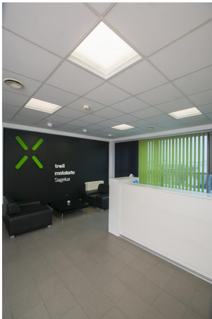
Biuro Luxiona Poland, Warszawa

Oprawa kasetonowa do sufitów podwieszanych modułowych. Kaseton produktu wykonany z blachy stalowej, lakierowanej proszkowo na kolor biały. Cechą charakterystyczną Agata LED Deco Smooth jest „wsunięta” przesłona, która po zamontowaniu oprawy znajduje się powyżej poziomu sufitu. Zabieg ten daje bardzo ciekawy, dekoracyjny i oryginalny efekt. Oprawa dostępna z przesłoną mleczną PLX lub mikropryzmatyczną i wyposażona w wysokowydajne źródła LED. Strumień świetlny źródeł LED to 5400 lm. Temperatura barwowa 3000 K lub 4000 K. Oprawa rekomendowana do oświetlania obiektów użyteczności publicznej.