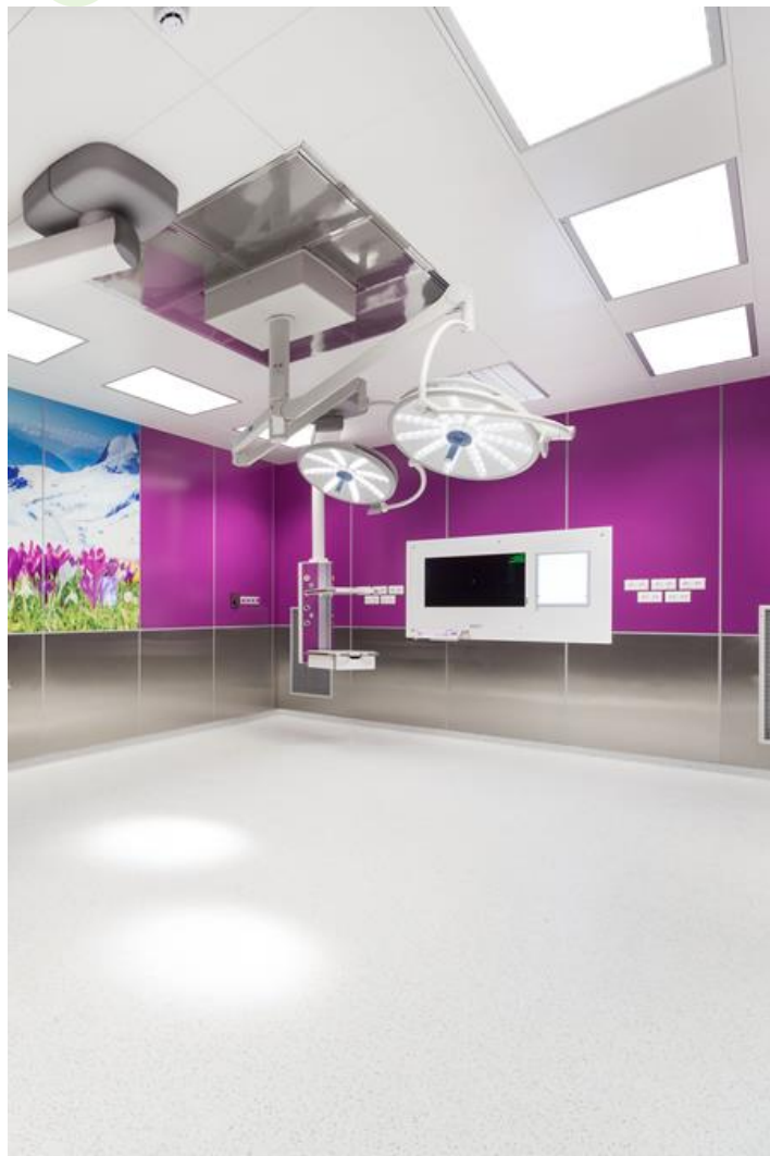
Sala operacyjna, Korfantów

Oprawa przeznaczona do sufitów podwieszanych modułowych oraz gipsowo-kartonowych, wyposażona w wysokowydajne panele LED. Kaseton oprawy wykonany z blachy stalowej, lakierowanej proszkowo na kolor biały. Układy optyczne i przesłony montowane w ramce aluminiowej. Produkt zapewnia jednorodny rozkład światła na przesłonie bez cieni i jaśniejszych punktów bezpośrednio pod źródłami LED. Oprawa rekomendowana do: sal operacyjnych, gabinetów zabiegowych oraz oddziałów intensywnej opieki.