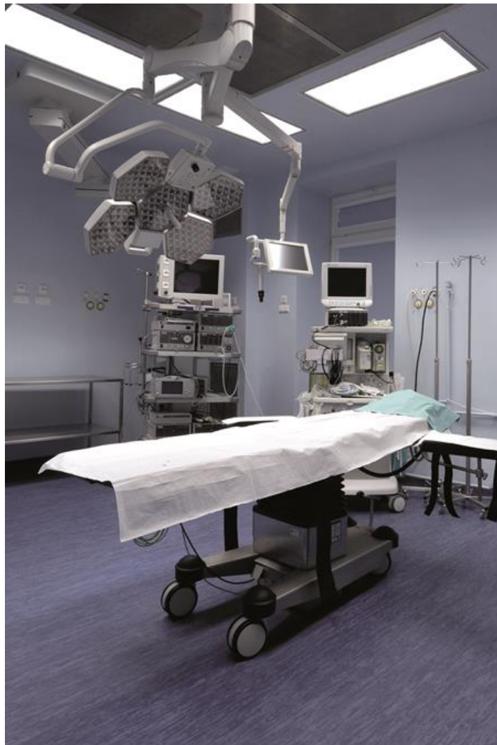
Międzyleski Szpital Specjalistyczny, Warszawa

LUXIONA Poland jako jedna z nielicznych firm w Europie uzyskała dla swoich opraw wskaźnik CRI>95 (z wysoką wartością składowej R9 i R13, idealnie oddających barwę tkanek i krwi). Oprawa jest rekomendowana do sal operacyjnych gdzie zastosowane oświetlenie powinno idealnie oddawać barwy skóry, krwi, tkanek (wysoka składowa R9 – odpowiedzialna za oddawanie barwy „głęboko czerwonej” i R13 – odpowiedzialna za oddawanie barwy „oranżowa jasna”). Oprawa przeznaczona do sufitów podwieszanych modułowych oraz gipsowo-kartonowych, wyposażona w wysokowydajne panele LED. Kaseton oprawy wykonany z blachy stalowej, lakierowanej proszkowo na kolor biały. Układy optyczne i przesłony montowane w ramce aluminiowej.