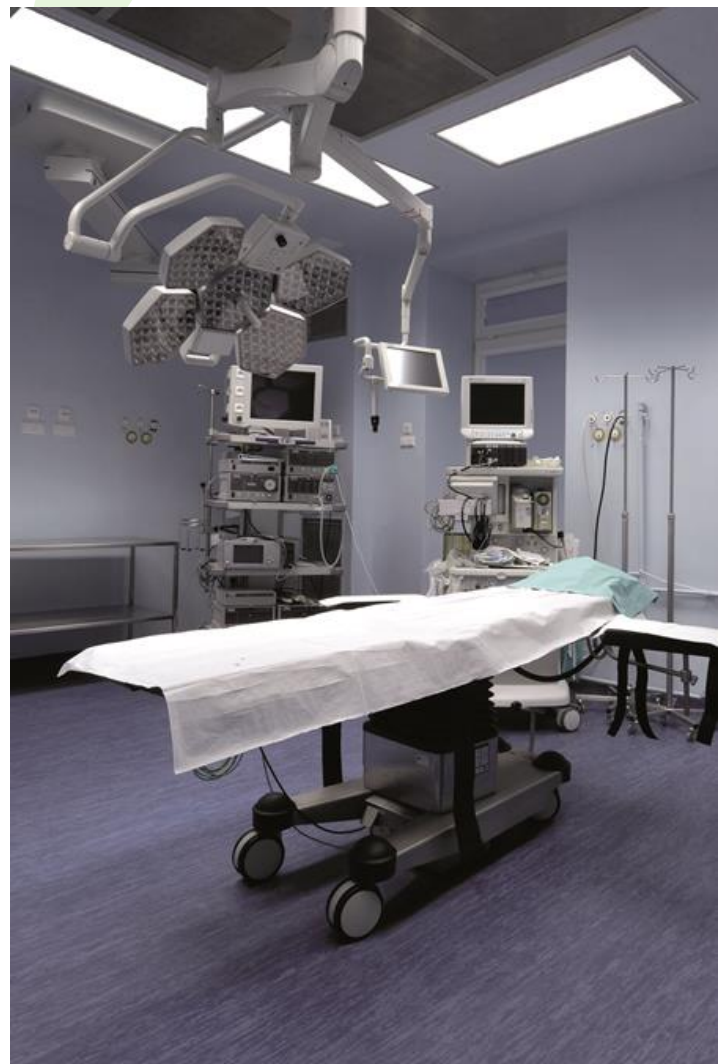
Międzyleski Szpital Specjalistyczny, Warszawa

Produkt dedykowany do pomieszczeń czystych o podwyższonych klasach czystości ISO 7-8-9. Oprawa przeznaczona do sufitów podwieszanych modułowych, wyposażona w wysokowydajne panele LED. Kaseton oprawy wykonany z blachy stalowej, lakierowanej proszkowo na kolor biały. Układy optyczne i przesłony montowane w ramce aluminiowej.