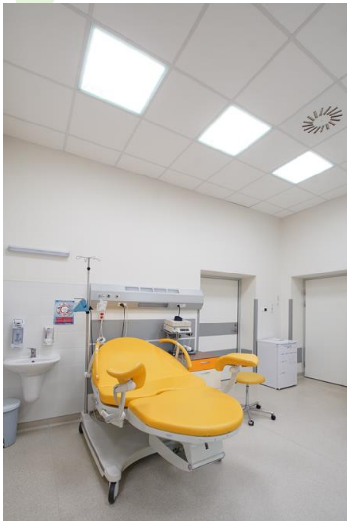
Maternity ward, Hospital in Goleniów

Luminary dedicated for the clean rooms of increased cleanliness class ISO 5-6. Luminary designed to module suspended ceilings, equipped with highly efficient LED panels. Luminary body made from steel sheet, powder coated in white. Its characteristic feature is lack of aluminum frame what allows to exclude the unwished-for contamination in clean rooms. There are no visible elements joining the diffuser and the luminary body.