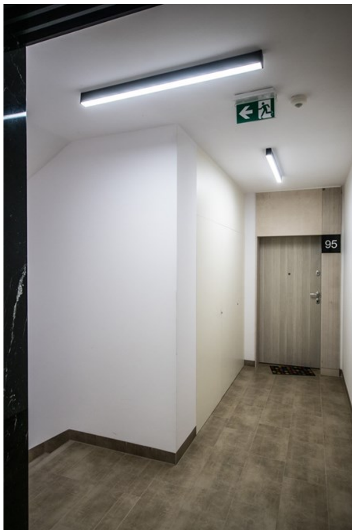
Osiedle "Haven House", Warszawa

Oprawa wykonana z profilu aluminiowego. W porównaniu z tradycyjnym X-Line LED, zmniejszone zostały gabaryty oprawy, a całość została zamknięta w wąskim na 48 mm profilu liniowym, co dodało produktowi bardziej eleganckiej formy. W X-Line Slim jako układ optyczny zastosowano soczewki. Całość pozwala manipulować światłem i tworzyć systemy świetlne, ułatwiając tworzenie we wnętrzach warunków komfortowego widzenia i ich estetycznego wyglądu. Oprawa X-Line Slim Surface przeznaczona jest do montażu bezpośrednio na stropie. Oprawa wyposażona w moduły LED dostosowane do regulacji temperatury barwowej światła w zakresie od 2700 K do 6500 K.