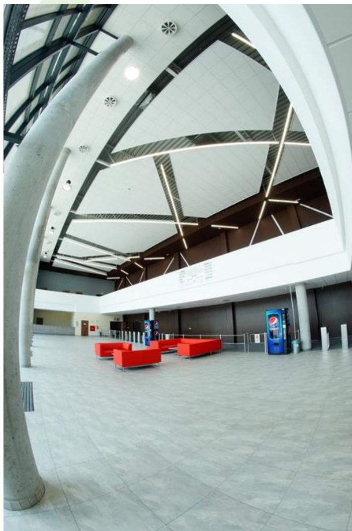
Halle in der Messe Bydgoszcz

Innenbeleuchtung. Montage: Anbau an der Decke oder an Aufhängebügeln. Gehäuse aus Aluminium. Arbeitstemperaturbereich: 5 \div 30^{\circ} \text{C} . Stoßfestigkeitsgrad: IK04. Schutzklasse: I.