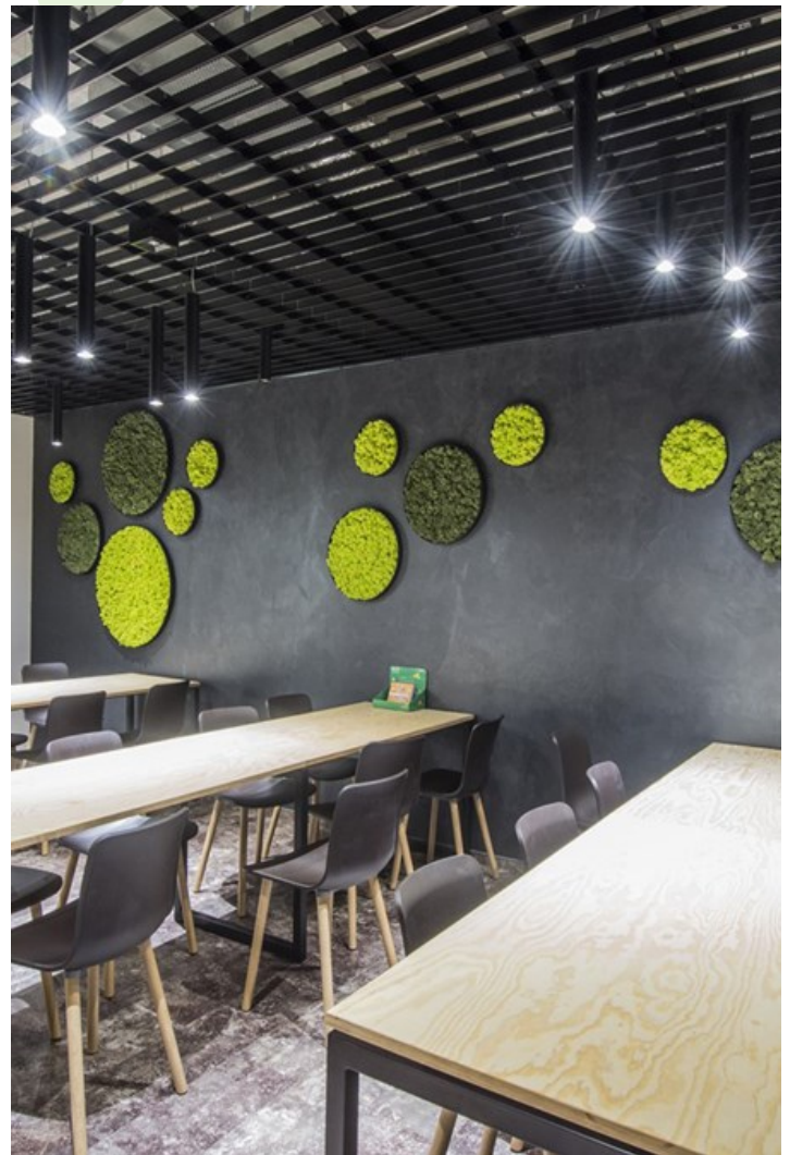
Alior Bank, Warszawa

Oprawa zwieszana o oświetleniu punktowym, pełniącym funkcje dekoracyjne lub światła dodatkowego. Podłużna tubularna obudowa wykonana z aluminium. Możliwe do wyboru różne warianty długości, duża paleta barw pozwalająca wyróżnić się kolorystyką do projektowanych wnętrz oraz regulowana wysokość zawieszenia. Zastosowanie: restauracje i kawiarnie, jadalnie i kuchnie, reprezentacyjne recepcje, pomieszczenia wypoczynkowe.