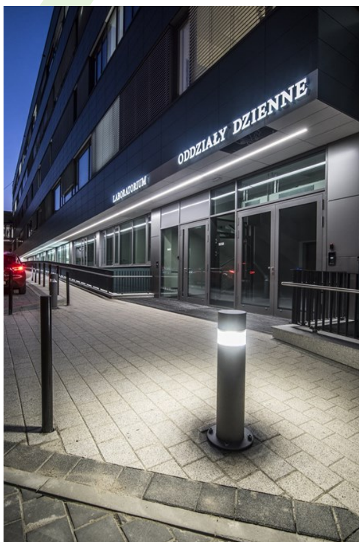
Nicht-invasives Medizinzentrum, Gdańsk

Außenbeleuchtung. Montage: Pollerleuchte. Gehäuse aus Aluminium. Arbeitstemperaturbereich: -20 \div 30^{\circ} C. Stoßfestigkeitsgrad: IK08. Schutzklasse: I.