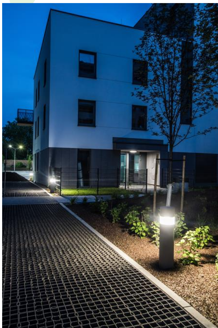
Osiedle na Woli, Warszawa

Oprawa zewnętrzna do montażu na utwardzonym podłożu (beton, kostka brukowa lub fundament) wyposażona w wysokowydajne, energooszczędne źródła LED najnowszej generacji. Obudowa odporna na korozję, wykonana z aluminium. Produkt przeznaczony do efektywnego oświetlenia ścieżek spacerowych, parków, terenów rekreacyjnych, obszarów mieszkalnych. Stopień ochrony przed wnikaniem ciał stałych, pyłu i wilgoci: IP65.