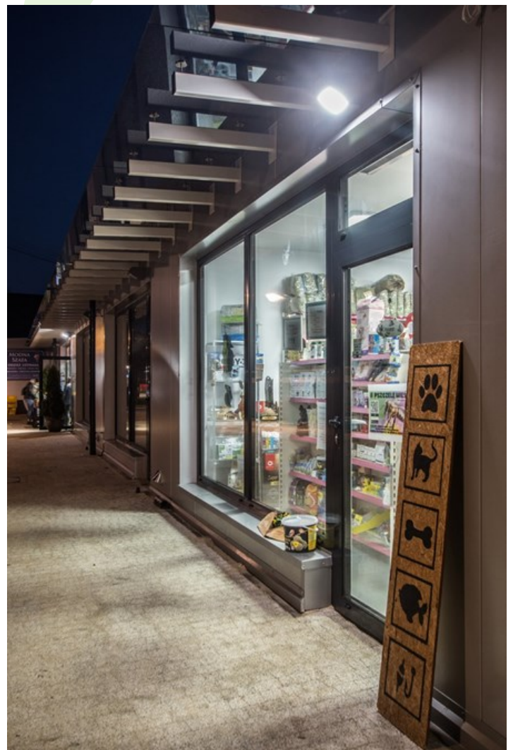
Bazar "Mój Rynek", Brwinów

Korpus oprawy wykonany z blachy stalowej malowanej proszkowo. W oprawie istnieje możliwość montażu modułu awaryjnego z termostatem do pracy w niskich temperaturach (-25° C). Oprawa daje możliwość montażu do ściany pionowej bądź też sufitów. Oprawa rekomendowana jest do oświetlenia wejść budynków, ciągów komunikacyjnych, tuneli, wejść do metra itp.