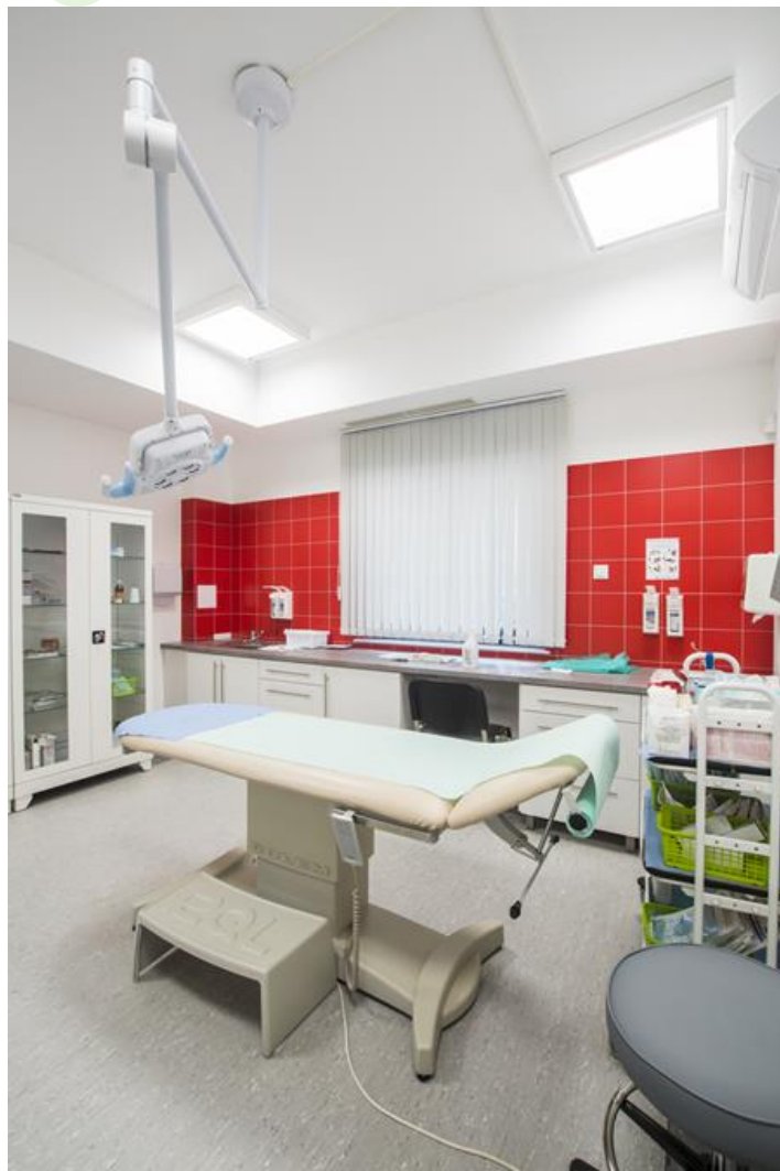
Samodzielne Publiczne Pogotowie Ratunkowe, Pruszcz Gdański

Oprawa przeznaczona do montażu nastropowego, wyposażona w wysokowydajne panele LED. Kaseton oprawy wykonany z blachy stalowej, lakierowanej proszkowo na kolor biały. Układy optyczne i przesłony montowane w ramce aluminiowej. Produkt zapewnia jednorodny rozkład światła na przesłonie bez cieni i jaśniejszych punktów bezpośrednio pod źródłami LED. Oprawa rekomendowana do: sal operacyjnych, gabinetów zabiegowych oraz oddziałów intensywnej opieki.