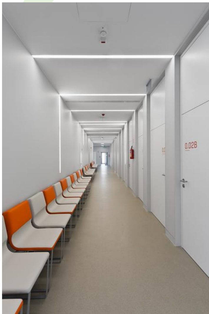
Krebs Präventionszentrum, Warschau

Innenbeleuchtung. Montage: Einbauleuchte für Deckenmontage. Gehäuse aus Stahlblech. Arbeitstemperaturbereich: 5 \div 30^\circ \text{C} . Stoßfestigkeitsgrad: IK04. Schutzklasse: I.