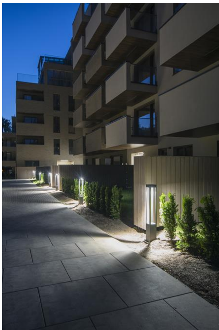
Osiedle "Awangarda", Warszawa

Ażurowa konstrukcja z dużymi wycięciami płaszczyzn bocznych co nadaje oprawie lekkość. Szczelny moduł LED ze zintegrowaną soczewką, zapewniającą czterokierunkowy, symetryczny rozsył światła. Montaż w podłożu na specjalnie zaprojektowanych fundamentach. Możliwe wykonanie w opcji z redukcją strumienia lub ściemniające DALI. Zastosowanie: oświetlenie ścieżek spacerowych, parków, terenów rekreacyjnych, obszarów mieszkalnych, ogrodów, terenów działkowych. Stopień ochrony przed wnikaniem ciał stałych, pyłu i wilgoci: IP65.